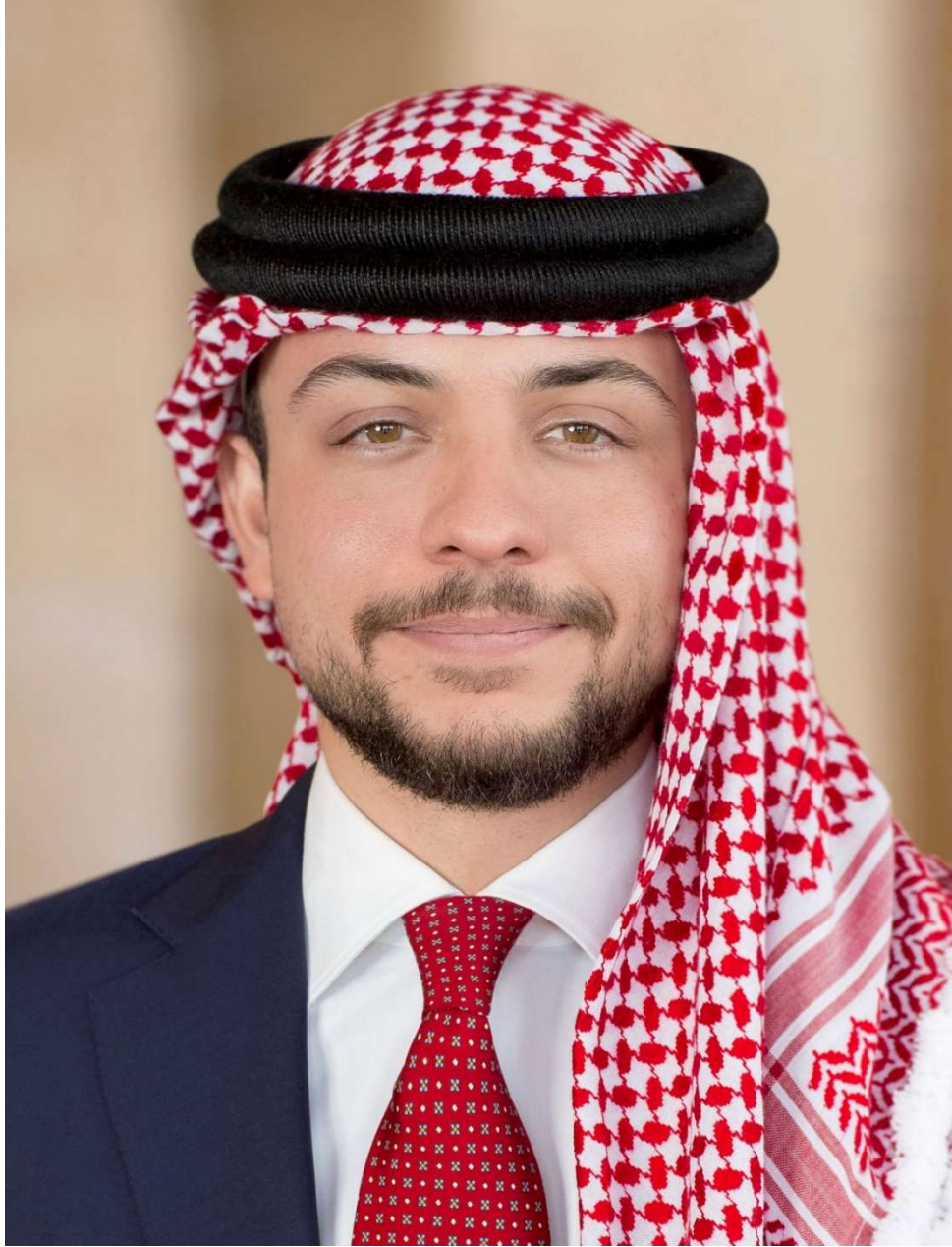
حضرة صاحب السمو الملكي الأمير حسين ولي العهد المعظم