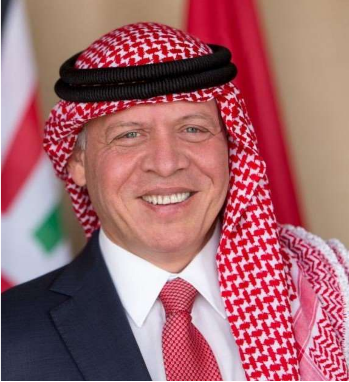
حضرة صاحب الجلالة الملك عبدالله الثاني بن الحسين المعظم